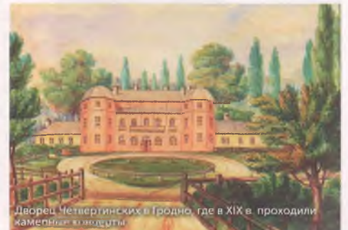
Дворец Четвертинских в Гродно, где в XIX в. проходили камерные концерты