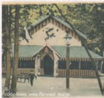
Летний театр, или Собрание