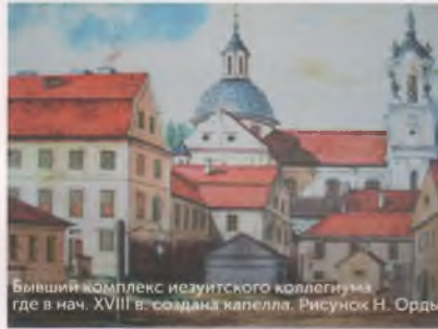
Бывший комплекс иезуитского коллегииума, где в нач. XVIII в. союдала капелла. Рисунок Н. Орды

вестные в Европе солисты, такие как Анна Жеребцова-Андреева. Гродненское благородное собрание имело и летнее помещение, которое располагалось в городском парке (нынешнем парке имени Жилибера).