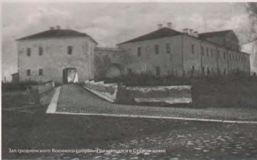
Зал гродненского Военного собрания размещался в Старом замке