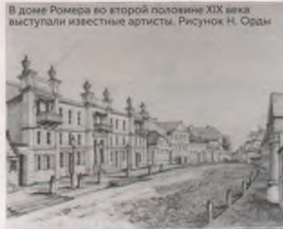
В доме Ромера во второй половине XIX века выступали известные артисты. Рисунок Н. Орды

Зал военного собрания, достаточно обширный, находился на втором этаже Старого замка. Для создания зала на крыше бывшего дворца Стефана Батория была устроена мансарда. В итоге зал стал более просторным в высоту и получил хоры на втором ярусе для размещения оркестра.